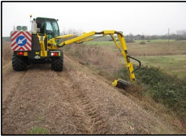
Intervento di sfalcio lungo la rete consortile