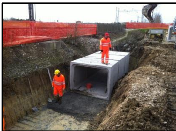
Il cantiere per la realizzazione del collegamento del fosso di Gaggio con la fossa Storta in Comune di Marcon