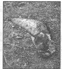
Uno dei pesci affiorati nell'ex discarica Ca' Perale

Polizia provinciale di Venezia che ha prelevato degli animali per farli analizzare. Le guardie ambientali sospettano che qualche sostanza sia filtrata nel laghetto della cava. Inoltre sono stati trovati resti di bivacchi e rifiuti. Nelle immediate vicinanze poi, lungo una via esterna alla cava, in località ponte Vecchio, le guardie hanno rinvenuto un capretto bianco, morto e abbandonato dentro una pozza d'acqua. L'animale è stato rimosso dai vigili del fuoco e dal veterinario dell'Asl. La Guardia nazionale ambientale è una associazione che opera in tutta la Penisola; in Veneto agisce una decina di uomini. (S.Bet)